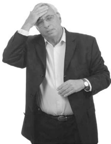
发烧往往是许多感染性病变的信号,但由于老人的体温

调节系统对病变的反应较为迟钝,神经系统对发烧的感知反应力下降,因此,当老人自身感知发烧时,往往病变已经很严重。