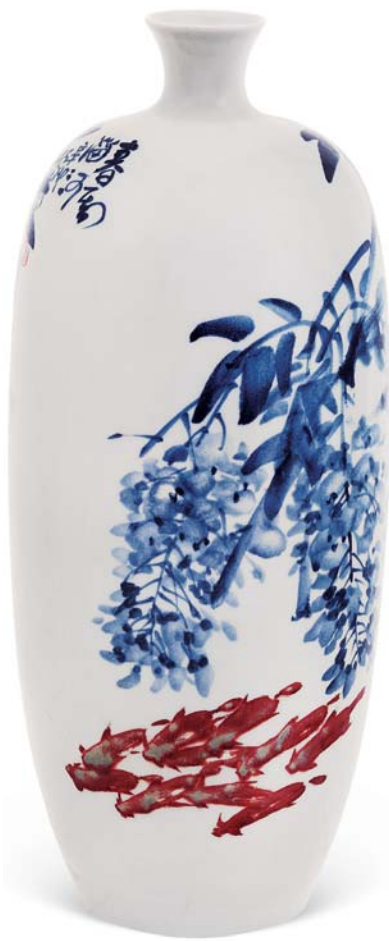
▲春暖 冬瓜瓶 (青花釉里红) 56cm×15cm 2011年