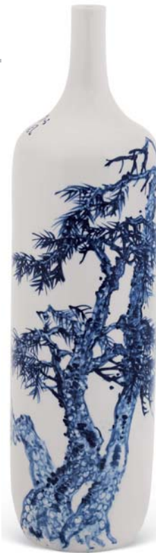
▲松风 长颈瓶 (青花) 70cm×15cm 2012年