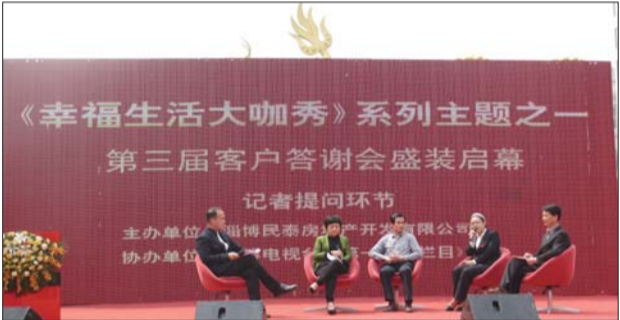
答记者问环节。