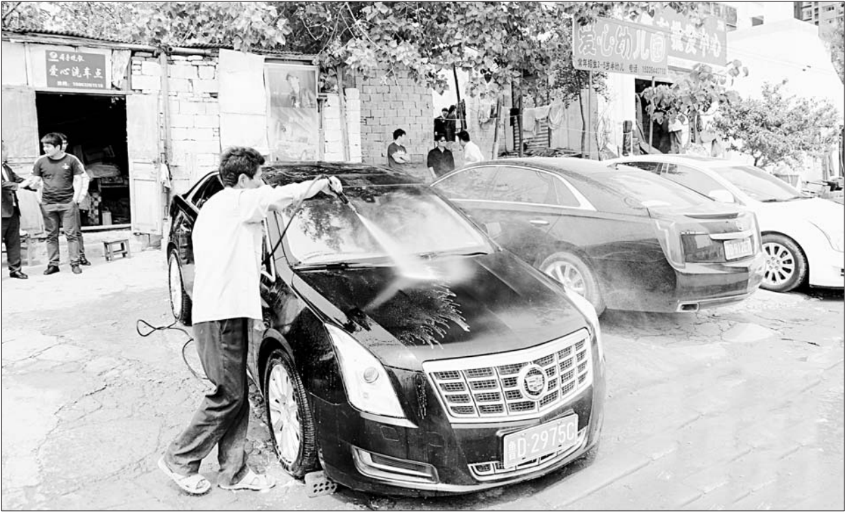
凯迪拉克车友会成员在排队洗车。