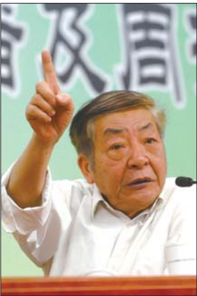
10日,北大原副校长梁柱做客齐鲁大讲坛。

富强、民主、自由、平等、爱国、敬业……社会主义核心价值观的实现,大学生要做什么,习近平要求大学生要“勤学、修德、明辨、笃实。”在山东省社科普及周启动仪式上,第77期齐鲁大讲坛邀来北大原副校长梁柱教授带来一场“当代大学生要勇于担当实践和传播社会主义核心价值观的历史责任”讲座。