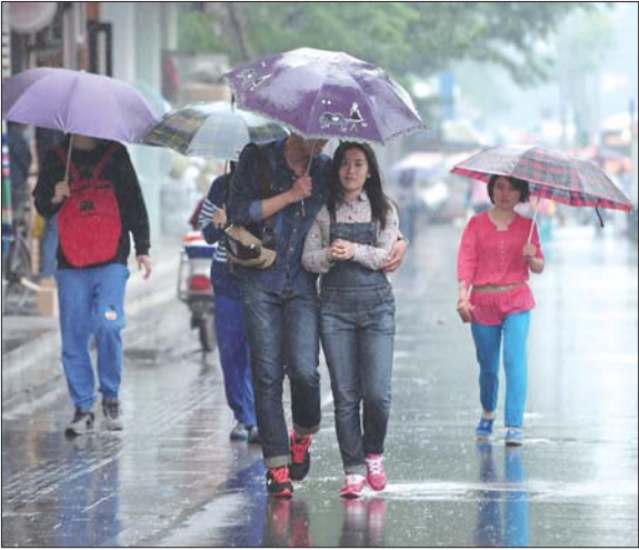
10日下午,在济南街头,人们在雨中行走。

区。其中,我省大部分地区降小到中雨,鲁西南局部地区下到大雨的雨量。 据省水文局统计,5月10日8时至18时全省平均降雨量7毫米,过程降雨量较大的站点,济宁任城区黄庄31.5毫米,泰安岱岳区大汶口31.5毫米,济宁泗水县贺庄29.0毫米。 据省气象台预报员介绍,11日白天,这一次全省性的降雨天气还将持续;11日下午开始,降雨自西向东逐渐结束,到晚间预计除半岛东部地区,我省其他地区的降雨就基本结束了。 雨过天晴后,到下周初气温也将明显回升,预计内陆地区的高温将再回到28℃左右的水平。