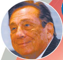
快船队老板斯特林