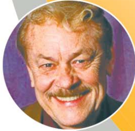
湖人已故老板巴斯