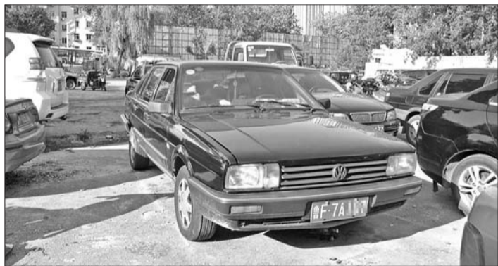
被查获的“最牛”违法车。

本报烟台5月13日讯(记者 钟建军 通讯员 全福 姚微) 12日,烟台市交警支队第一大队查获一辆“最牛”违法车,这辆车有190起交通违法未处理,算起来要扣580分、罚款27300元,并且该车驾驶员涉嫌吸毒,目前已被警方拘留。