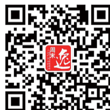
山东最实用的微信

另外,香港中文大学(深圳)今年还将在内地招收50名以内的硕士和博士生。据悉,香港中文大学(深圳)预计今年在山东招收19人,其中理科11名,文科8名,录取批次在提前批中。