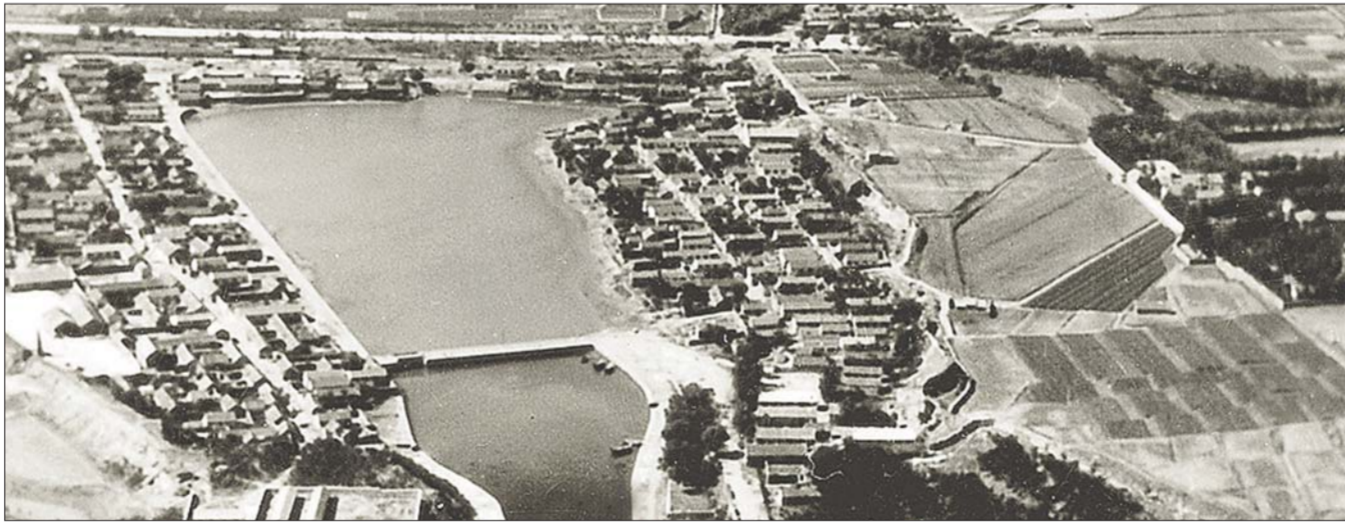
1981年的蓬莱阁航拍照片。