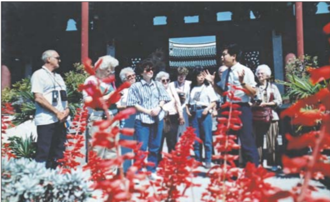
上世纪80年代中期，天后行宫作为承载烟台传统文化的重要景点，常常是外宾和外地游客的必去之地。