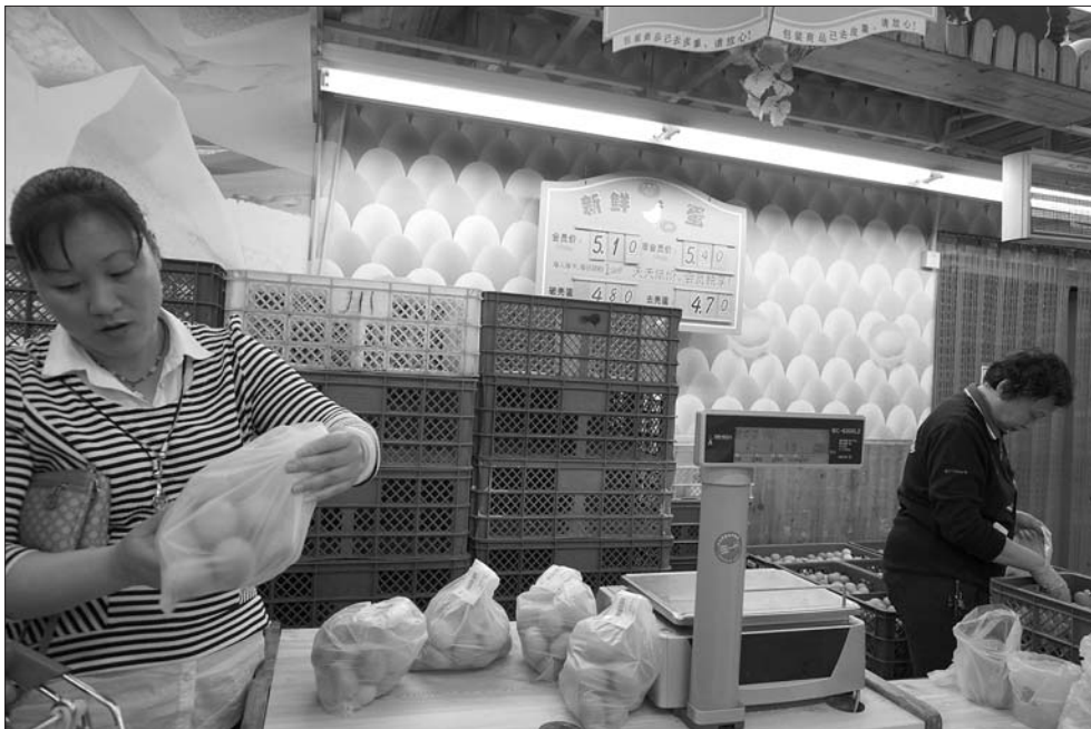
超市鸡蛋每斤5.1元的优惠价,相当吸引市民的目光。

“菜价落下来了,鸡蛋却蹿上去了,再这么涨上去,鸡蛋也吃不起了。”年后,鸡蛋价格节节攀升,从3月份的4元一斤,涨到了最近的5.7元一斤,这让家庭主妇们忍不住吐槽。“火箭蛋”之下,不同行业的人各有各的话说。业内人士预计,受存栏量减少的影响,今年鸡蛋价格的高价态势还将持续。