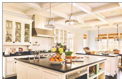
现代简约风格厨房

随着《舌尖上的中国 II》开播,美食旋风再一次刮起,在我们只能对别人制作出的美食垂涎欲滴时,何不自己动手,烹调属于自己的美味。但在过去,很多人对厨房的概念都是“脏、乱、差”,因此不愿意下厨。本期为您提供三种厨房搭配方案,营造舒适下厨环境,让舌尖上的美味轻松可得。