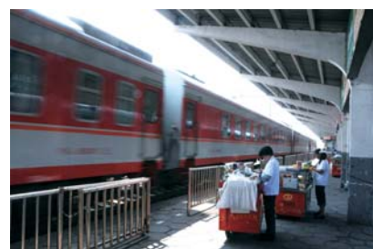
常年守候在站台的服务车。