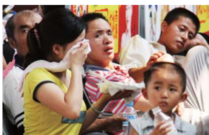
夏天的候车室如同蒸笼。