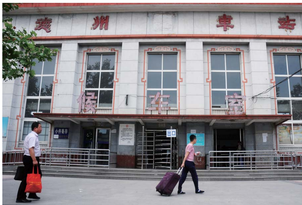
带着岁月痕迹的候车室。