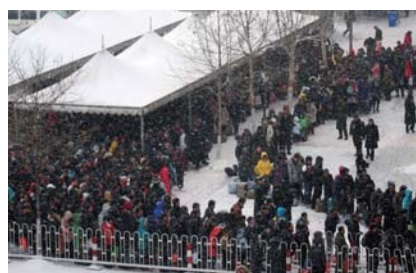
冬季的站外广场人头攒动。