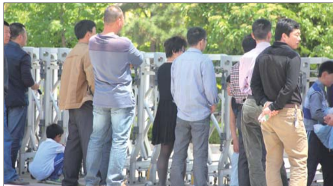
在学校大门外等待接孩子的父母

下午,记者从日照港中学相关负责人李老师处了解到,今年教育局规定,自5月12日起全市中学统一调整作息时间表,学校从学生健康、安全考虑,倡导学生回家午休,但是并没有强制,家远的学生仍可以留校吃饭、午休。