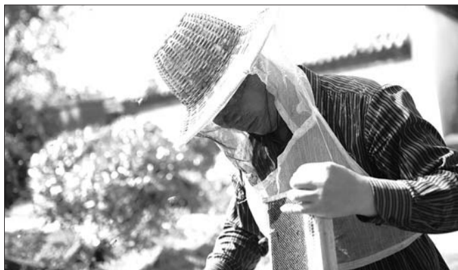
每次取蜂巢,小蜜蜂都会受惊到处飞。