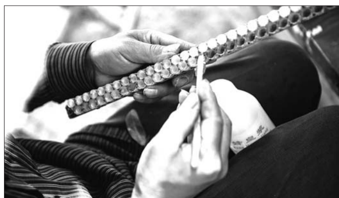
收获更多的蜂王浆,对老夫妻俩来说就是好收成。