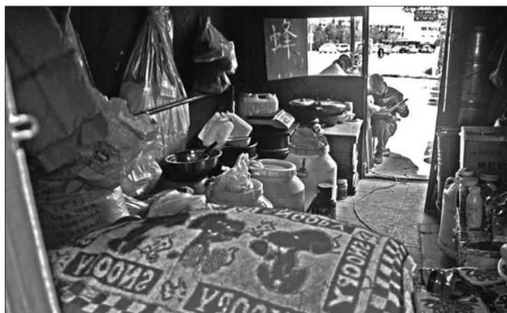
一个帐篷内的锅碗瓢盆加上床铺就是夫妻俩的“家”。