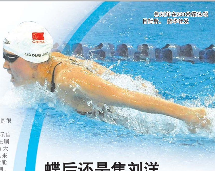
焦刘洋在200米蝶泳项目封后。

值得一提的是,国家体育总局游泳管理中心副主任尚修堂这几天一直在游泳馆,按照他的说法,朱志根不带孙杨是因为身体有病,而且这次在青岛比赛之后回去还要继续接受治疗。官方给出的朱志根因为身体有病所以放弃执教孙杨,这个说法已经站不住脚,虽然朱志根的身体确实有恙,一直在吃药,但是没有达到不能执教的地步。朱志根与孙杨分手的原因,仍然是两人之间的矛盾,而且一直没有彻底解决,这个矛盾,也是朱志根咬紧牙关再也不提孙杨的根本原因。