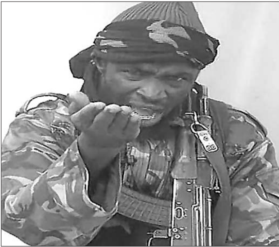
“博科圣地”头目谢考