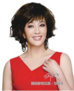
明星不老的秘密武器——热玛吉

4、长效紧肤，重塑肌肤轮廓。持久紧肤，雕塑脸型(修饰下颌轮廓，收紧双下巴)；重塑颈、背、腰、腹、臀、腿各部位轮廓。