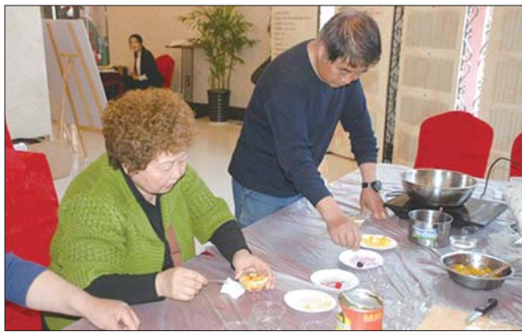
市民现场DIY果冻布丁

“平时只是吃超市里买的果冻,这次可以亲手制作并品尝新鲜、健康自然的布丁,真是太开心了,星汇凤凰的活动真的很不错,既能让我的孩子从中体验到无穷的乐趣,也可让他认识到新的朋友。”到场