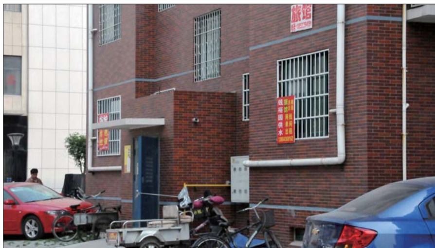
一小区内不少住户都打出了旅馆招牌。

还有一些考研学生表示并不会在乎这些,“选择这里觉得离学校近,不会熄灯,可以彻夜看书,非常方便。”