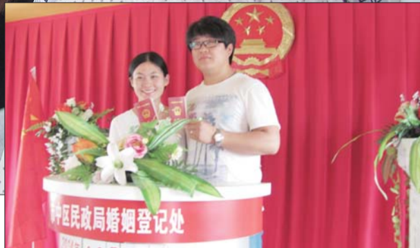
▲婚姻登记处排起长队。 本报见习记者 连婧婧 摄 ▶拿到结婚证,这对新人很甜蜜。 本报见习记者 连婧婧 摄

本报枣庄5月20日讯(见习记者 连婧婧)“520”谐音“我爱你”,许多情侣们选择在这样一个特殊的日子结婚登记,敲定终身。20日,市中区民政局新人登记场面火爆,当天就有140对新新人