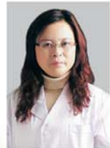
雅 娴 抗衰老专家、注射美容及激光治疗专家

一名医生同时做多项工作,自然不能全面精通。在韩国,专业医生只做专业的事。在韩氏,疤痕修复由多位专业疤痕医生专职进行,以其丰富的经验,努力将其做到极致。