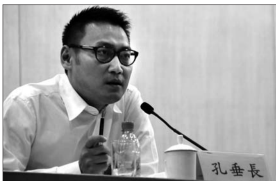
孔垂长发表主题演讲。本报记者 张晓科 摄

据了解,作为设学孔子故里的高等学府,曲师大早在1956年就成立了孔子研究会,并随后设立了孔子研究室、孔子研究所,是国内最早成立孔子儒学专门研究机构的高校,被誉为我国经学研究八大重镇之一。