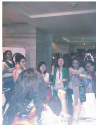
“英语演讲班”教师培训现场。

本报记者:谢谢董校长的详尽解答,从您的微信里了解到:凝辉新增了几位优秀的幼儿教师和英语专业八级的初中英语教师,最近