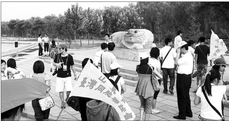
台湾游客在济南黄河岸边。

济南还有几处公园是依黄河而建的,像济南美里湖湿地公园,这个地方稍远一些,靠近京福高速,门票要40多元,里面好玩的项目不少,像钓鱼、真人CS、激情