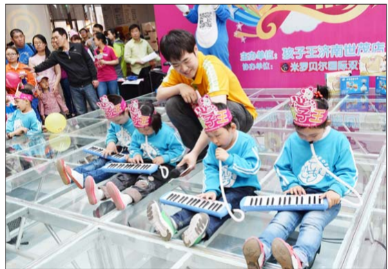
近日,济南一家儿童游乐场在周末举行亲子活动,引来众多家庭参与。(李冠军)