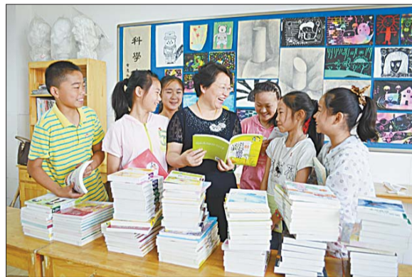
29日上午,齐鲁银行段店管辖行联合张庄路街道团工委向张庄小学和刘庄小学赠送图书400余册。(初鲁盼)