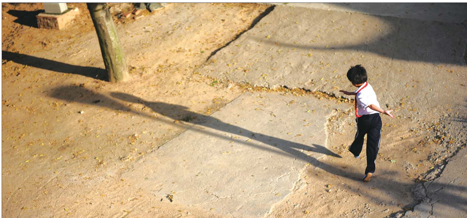
现在的乐乐活泼好动，敬老院开阔的院子是他的乐园。