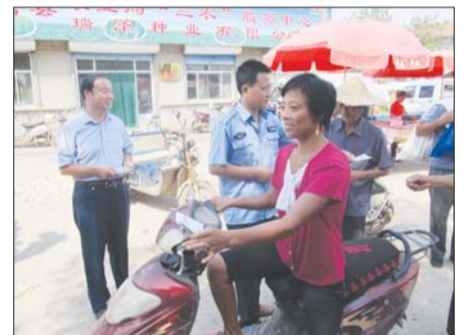
赶大集宣传环保知识。