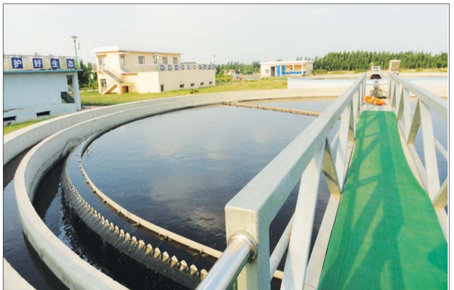
阳信县污水处理厂处理设施。

五是不断加大机动车尾气污染治理的力度,建成机动车环保检测线,实现了机动车环保监测、监管的覆盖,启动了黄标车提前淘汰补贴审核工作。昔日煤尘遮天蔽日,今朝靓丽蓝天白云。阳信县环保局通过科学规划、科学决策,紧抓大气污染防治不放松,全县环境空气质量稳定达到国家环境空气质量二级标准。