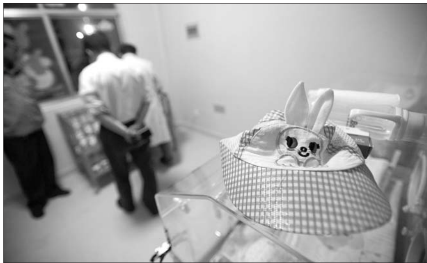
随孩子一起送到弃婴岛的一顶帽子。

福利院工作人员说,婴儿安全岛虽然为人性兜了底,但家庭终究是儿童成长的最佳环境,愿每位父母弃婴前三思再三思。