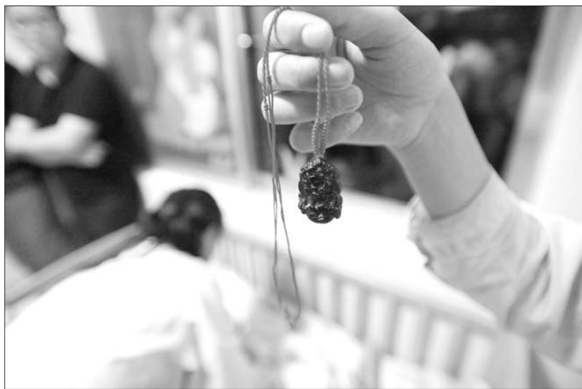
孩子被送到弃婴岛时,脖子上挂着一个玉坠。