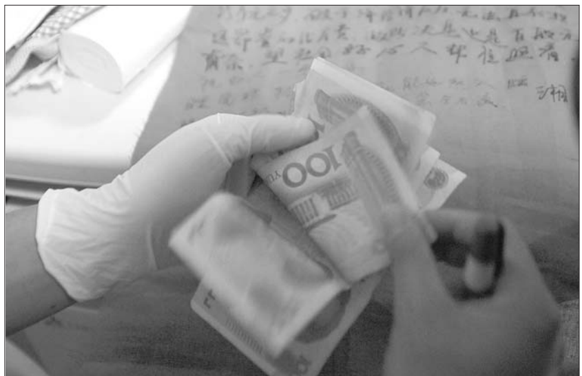
家属给孩子留下888元钱。