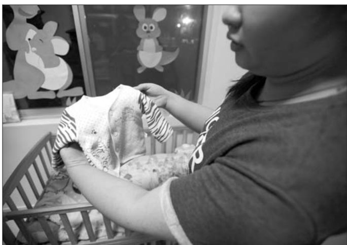
弃婴父母给孩子留下的衣服。