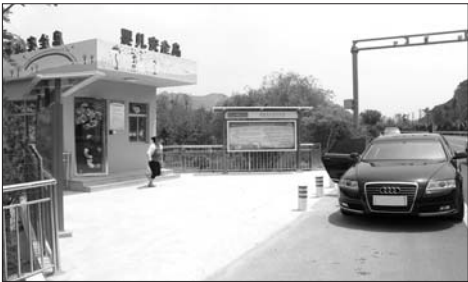
▶有的家庭开着奥迪车来弃婴岛。