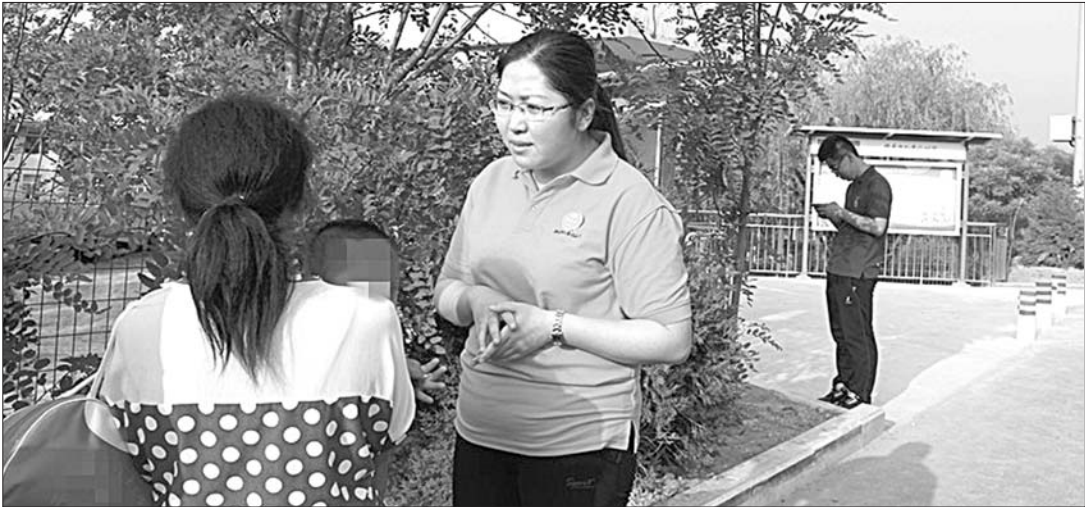
工作人员正在劝说带着病儿的残疾母亲。

两名女子最初退却了,带着孩子朝东走去。可是,她们并没有走。晚上10时20分许,两名女子依然将孩子放进了“弃婴岛”里面。