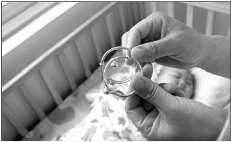
◀一名被送来的婴儿戴着一对银手镯。