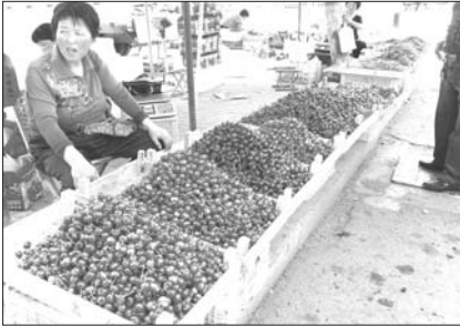
看着晶莹剔透的樱桃,垂涎欲滴。