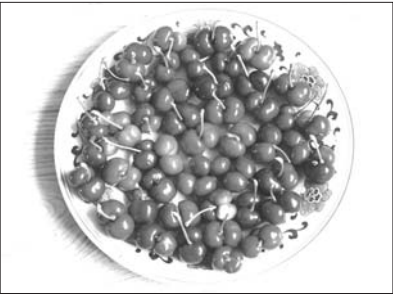
5斤樱桃,一盘双胞胎。