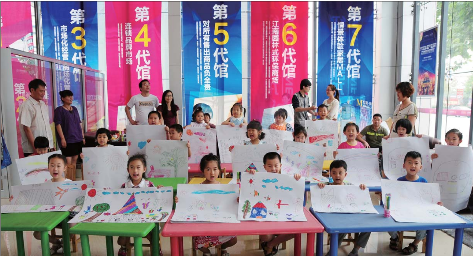
▲参赛小朋友正在展示自己的作品。