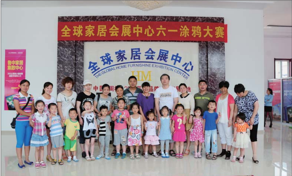
◀部分参赛小朋友和家长合影。