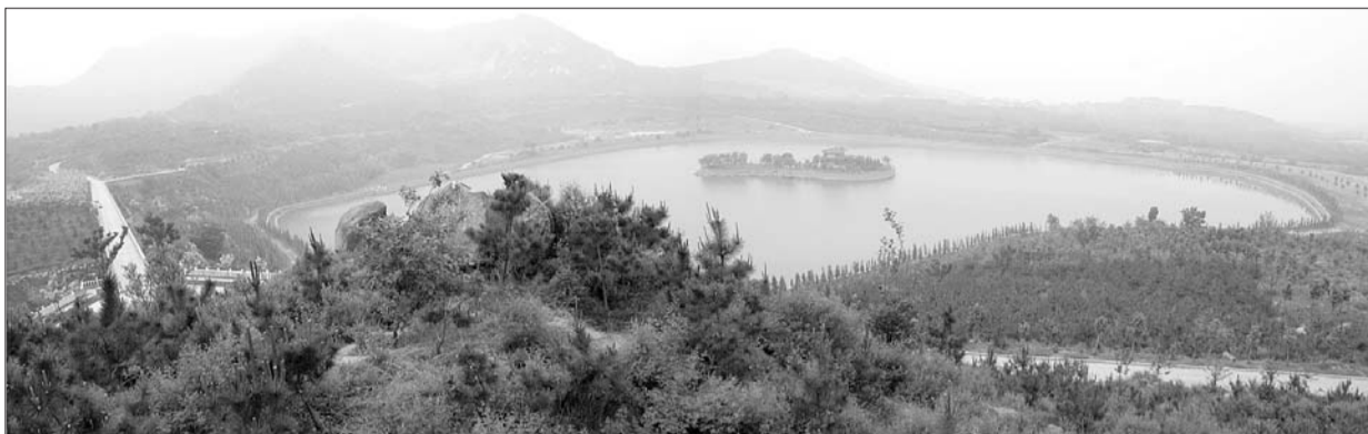
经过十年的治理,作为黛溪河源头的邹平嘉业生态园山青水秀,湖泊相连,成为全国水土保持示范园区。