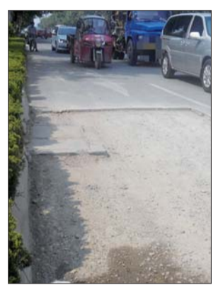
路面大坑已经开始维修。