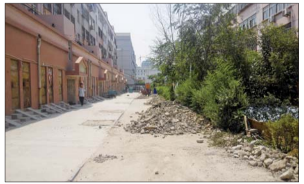
居民楼前大堆建筑垃圾。

对此,本报帮办记者找到小区物业,物业工作人员解释说,垃圾清理工作是由原来修路的施工单位负责的,之前已经清理了部分垃圾,但由于其他原因暂停了。目前,物业已经和施工单位进行沟通,将尽快将垃圾清理干净。