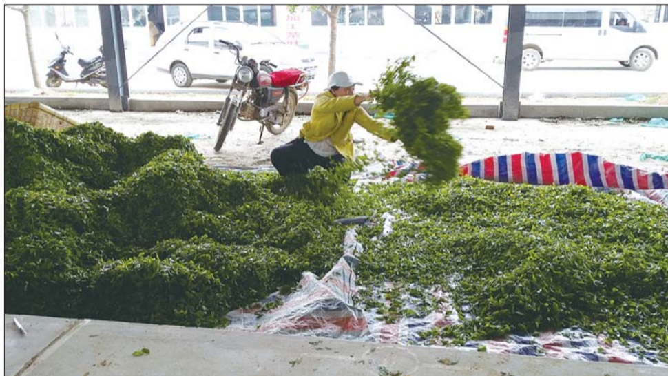
一位茶商将收购的鲜叶就地摊晾。

二轮春茶上市,茶农们的采茶速度也加快了。薄家口村的薄先生介绍,一轮春茶原料精细,出芽率有限,他们都要在茶棚上找寻鲜料,每采上一斤都要累得头晕眼花,对视力和体力有很大的考验。如今,二轮春茶上市,虽然没有一轮春茶价格高,但是一天的采摘量大了,收入也不少。现在他每天能采十多斤鲜叶,收入在五六十元。