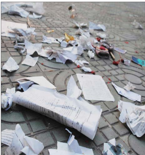
学生撕完扔在地上的书。

现如今的考生大都是“90后”,其直接、外露的天性是众人皆知的。或许在他们看来,教材、书本只是攀登人生阶梯的一架工具,现如今用完了,有何撕不得?如果说“撕书减压”是应试教育带来的恶果,难道学生的思想教育就没有漏洞吗?事实上我们的教育在给学生灌输知识的同时,明显缺乏思想领域的正确引导,青少年还有漫长的人生之路要走,高考只是个起步,如何以一种平和的心态对待压力,责任何其重也。(杨兵三)