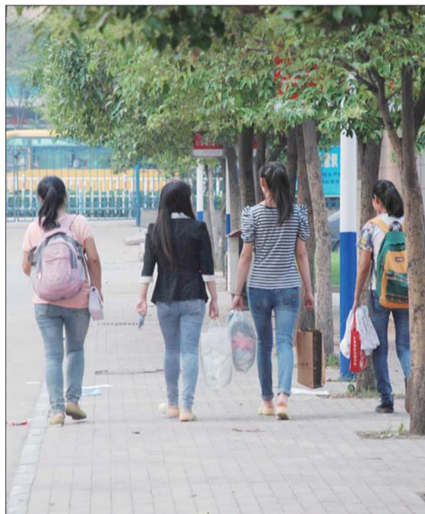
高三的学生们收拾自己的东西离开学校。

另外,有些同学在笔记本上给对方留下自己的祝福语。“要好好发挥,我们准备了那么久,一定会成功!”“加油,我们是最棒的!梦想的大门已经向我们敞开!”在同学们的笔记本上,一些人含泪举笔,祝愿和自己一同奋斗的同窗在高考的征途中凯旋而归。