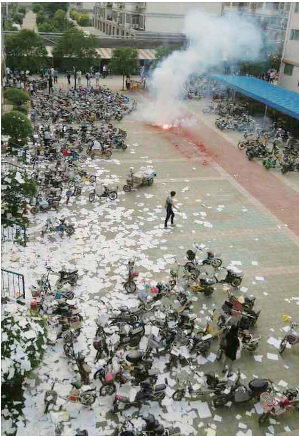
十六中的学生用撕书和放鞭炮的形式迎接高考。

本报枣庄6月5日讯(记者 韩微) 5日下午四点多钟离校前夕,枣庄市第十六中学北校区内,一张张纸屑从教学楼里翩翩而坠,更有红彤彤的鞭炮伴着学生们的欢呼响彻校园。