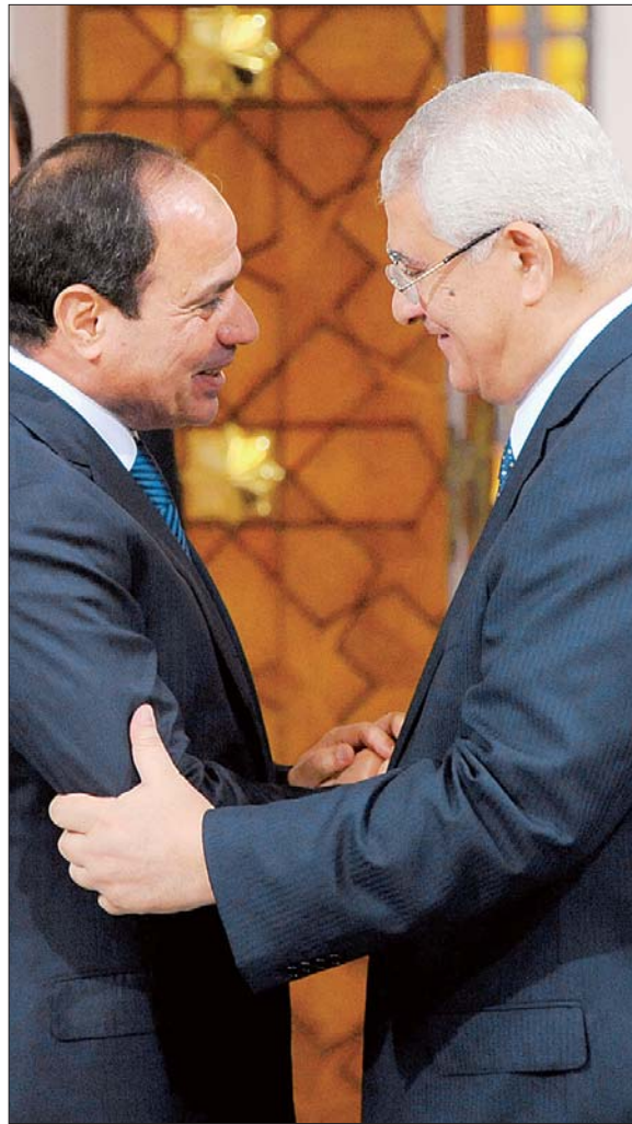
8日,在埃及开罗总统府,当选总统塞西(左)与临时总统曼苏尔在就职典礼上握手。