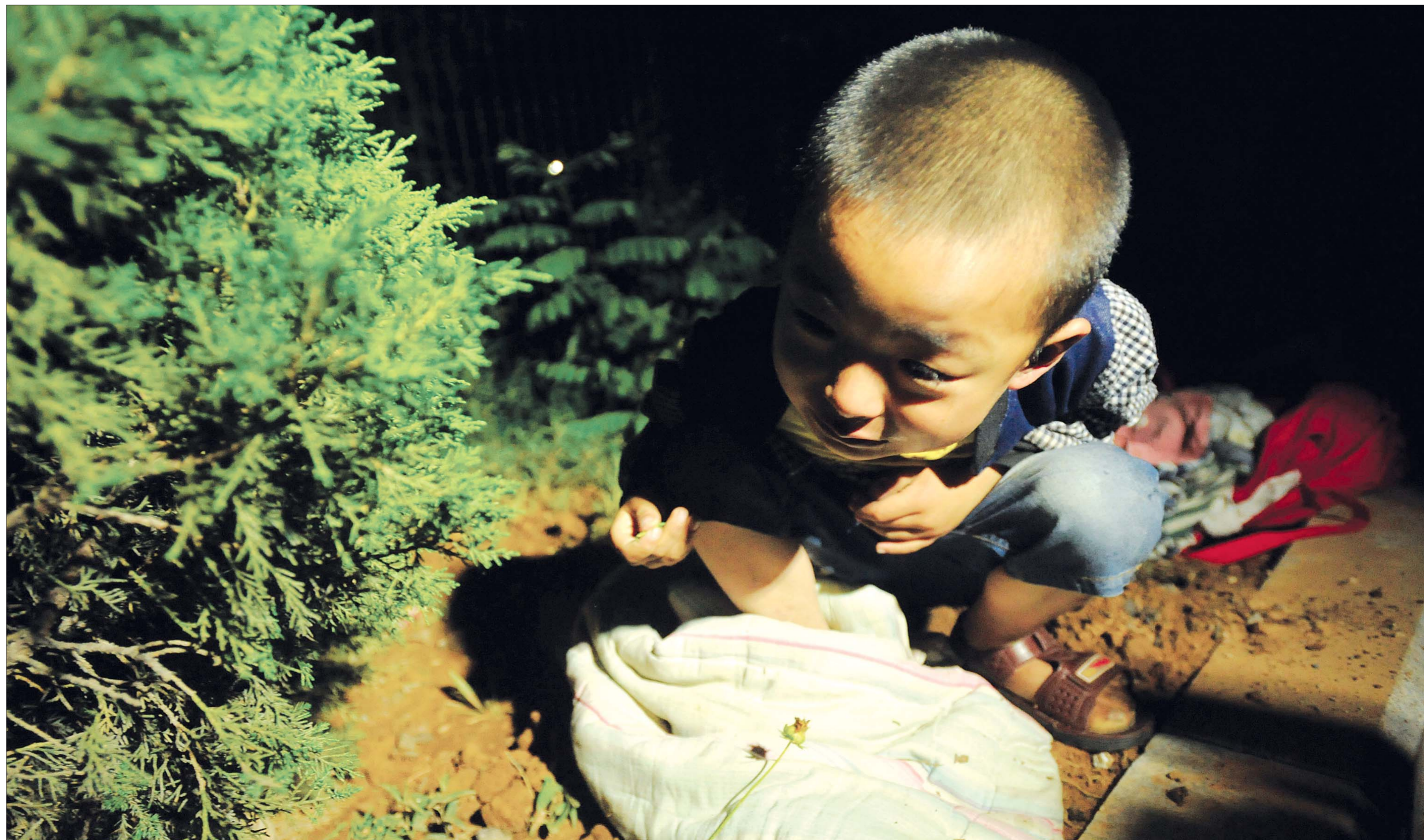
▲6月7日1时55分,一个六岁大的自闭症男孩被弃绿化带,无助和害怕让他号啕大哭,这也没能留住家人诀别的脚步。医生试图把孩子带回福利院,孩子却蜷缩成一团,像受到惊吓一般拼命拒绝。