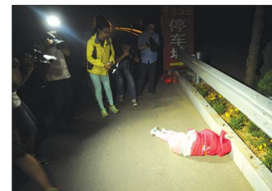
▲6月5日23时10分,一名处于昏睡中的孩子被弃于路边,孩子上衣口袋里写有父母亲笔字条,写明孩子生于2008年。