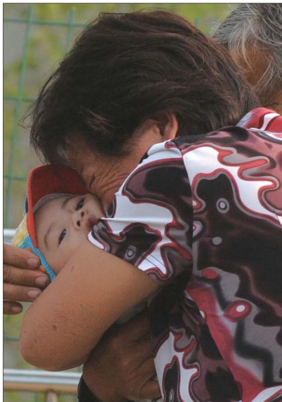
▲6月6日7点25分,老人痛苦地抱着患有先天性脑瘫的孙子站在安全岛门前。