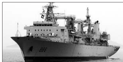
远洋综合补给舰千岛湖舰

岳阳舰是我国自主研发的新型导弹护卫舰,舰长134米、宽16米,满载排水量4000余吨,是海军新一代主力作战舰艇。