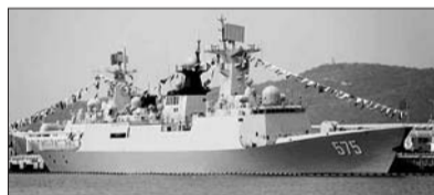
导弹护卫舰岳阳舰

担负此次参演任务的指挥舰海口舰,是我国自主研发的新型导弹驱逐舰,舰长155.5米、宽17.2米,满载排水量6400余吨。服役以来,海口舰多次出色完成重大军事演习、护航和出访任务,被誉为“中华神盾”。