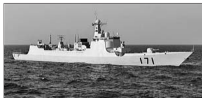
导弹驱逐舰海口舰

“环太平洋”演习由美国主导,被称为国际上规模最大的多边联合演习。自1971年起,定期在夏威夷附近海域举行。 苏联解体前,“环太”演习每年举行一次;苏联解体后,每两年一次。起初,“环太”演习以美苏两大军事体对抗为背景,主要针对苏联太平洋舰队。苏联解体后,“环太”演习逐步转变为和扩大到加强地区海上力量合作、共同维护海上安全等方面,演习科目也从传统的联盟作战逐步扩大到非传统安全领域,包括人道主义救援减灾、医疗救灾以及反海盗等。 “环太”演习至今已举行23次,今年6月将举行第24届。参与演习的国家也逐步增加。2012年,22个国家参与演习,其中,俄罗斯属首次参加。今年,参加国增加至23个,其中,中国和文莱首次参加。23个国家将派遣47艘舰艇和6艘潜艇,200余架飞机以及超过2.5万人参加此次演习。 据新华社