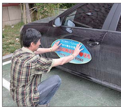
车主张贴“爱心送考”车贴

在一片期望中，为期两天的2014年高考已经画上了圆满的句号，广大考生终于可以松一口气了。身心放松之余，怎样让自己度过一个充实、快乐的暑假呢？烟台海昌鲸鲨馆、烟台海昌雨岱山温泉暑期门票特惠一定不容错过！即日起至8月31日，考生持中、高考准考证游览鲸鲨馆可享受50元/人的优惠票价，雨岱山温泉享受60元/人的优惠票价。看世界上最大的鲨鱼，泡深海养生温泉，让我们一起玩酷暑假！