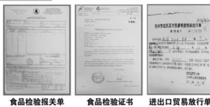
食品检验报告单 食品检验证书 进出口贸易放行单