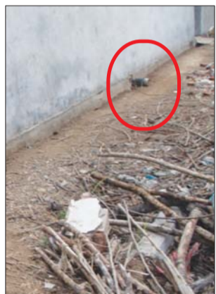
一管线扯到家中,工作人员将其切断,漏出原油。

虽然现场工作人员没有告知细管线的作用,但记者沿管线一路向西,经过一片农家菜地,发现它从墙角北侧一个窟窿伸进,墙南侧就是住户,整个管线长约20米。工人将管线切断,管口处漏出原油。记者继续询问工作人员,仍无人应答,又想到扯线村民家中探访,却发现大门紧锁。