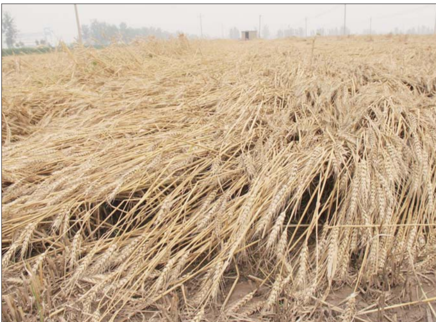
冰雹之后,滨湖镇一片麦地里的麦子全都倒地了。

本报枣庄6月10日讯(记者 甘倩茹 通讯员 孔祥春) 6月9日下午6点一过,滕州市开始狂风大作,八个西部乡镇开始“噼里啪啦”的下起冰雹,各乡镇农作物均有不同程度的损失。 10日,记者沿着红荷大道、济微路等多个滕州西部路段一路前行,道路两旁的农作物失去了夏天应有的生机。路上记者听到老农描述着前一日冰雹降落的情形:“长这么大头次见这么不要命的下法,二十多分钟,比起(19)87年那场冰雹还厉害,你看看咱这到嘴的粮食没有了。”在田间地头,也不时有路人对着伏地的庄稼唉声叹气。