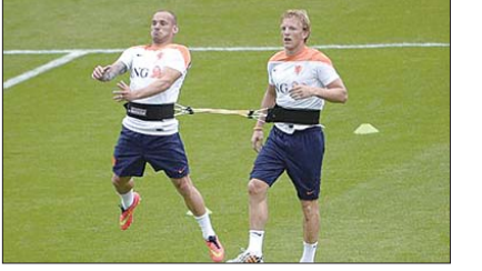
斯内德和库伊特在训练中。

荷兰国内媒体则批评说,荷兰队在选择集训地点时出现了错误,球队根本不应该选择下榻在巴西里约最著名的海滩Ipanema旁的酒店,因为这里游客云集,好玩的东西太多,外界的诱惑太大,球员很难静下心来备战。