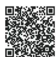
齐鲁晚报网世界杯专题