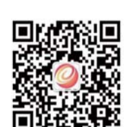
齐鲁晚报官方微信