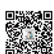
齐鲁晚报体育部官方微信