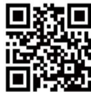
齐鲁晚报腾讯微博