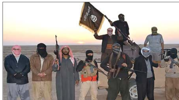
6月11日,伊拉克反政府武装人员在尼尼微省某地集结。

美国专家和伊拉克官员的话报道,这些美国专家今年早些时候访问伊拉克时得知,伊拉克领导人希望美国方面能空袭伊拉克反政府武装盘踞和训练的地区,打击武装人员,同时帮助伊拉克安全部队