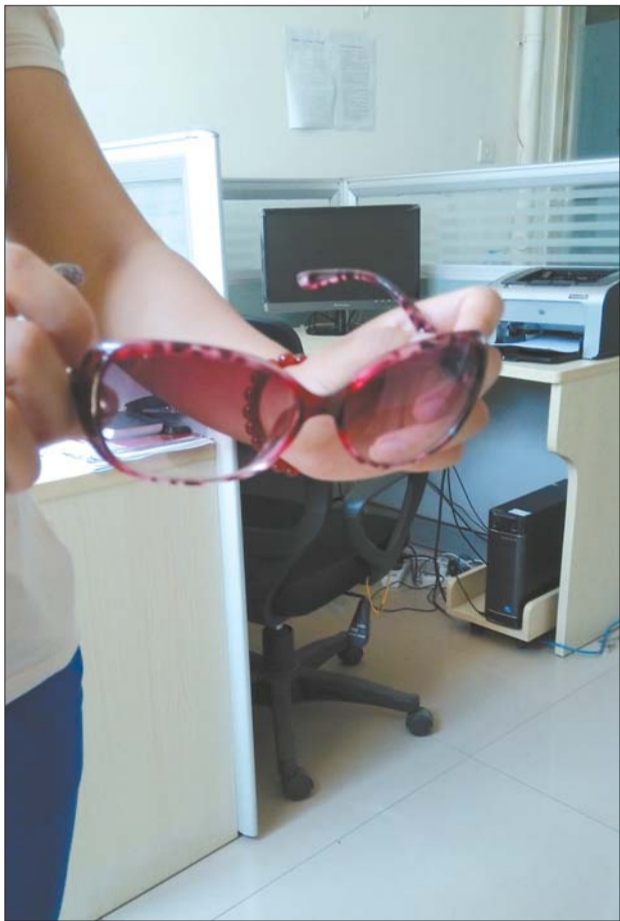
市民挑选眼镜,大多只看款式和价格,至于到底能不能防紫外线反倒不关心。