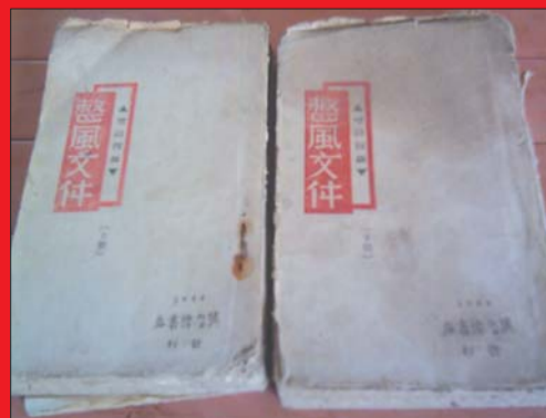
两本1944年的《整風文件》。