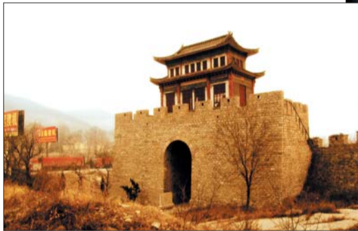
▲锦阳关 ▼齐长城遗址

“方五百里。”管子曰:“阴雍长城之地,其于齐国三分之一,非各之所生也。”又,管子曰:“长城之阳鲁也,长城之阴齐也。”齐宣王时,《齐记》载:“齐宣王乘山岭之上筑长城,东至海,西至济州。”此外,《史记·六国年表》也有记载:“(周)显王元年,齐威王十一年,赵侵我长城”。清代孙廷铨著有《颜山杂记》,对齐长城的年代作了更进一步的考证。他认为齐长城是在齐宣王时修的。据羌编钟铭:“入长城先,会于平阴。”编钟的铭文记载的年代是周威烈王二十二年(公元前404年),即完成于齐宣王时期。我们经过考察认为:齐长城早于秦朝长城,在当时条件下,如此工程不可能成就于一时。很可能是在周显王初年就已开始。当时,齐国大治,国富民足,乃成“战国七雄”之一。齐国励精图治,内修政治,外固国防,一直很关注南部的防御,经过几代人的努力,纵横千里的长城工程到齐宣王时得以最后完成。