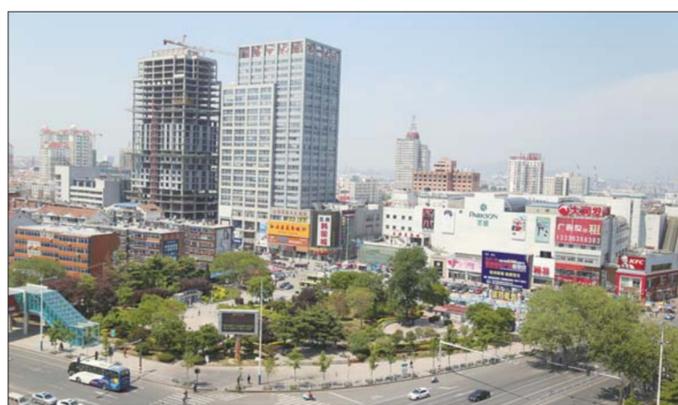
现在的展馆已经变成百盛商超,周围高楼幢幢。