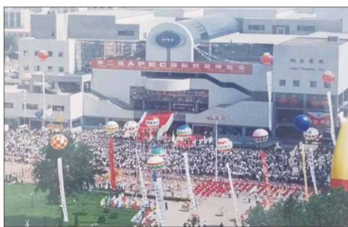
APEC博览会举行时的会馆。