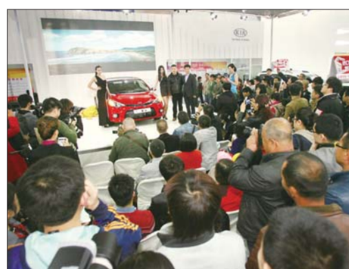
今年车展现场,新车发布吸引了众多参展市民围观。本报记者 赵金阳 摄