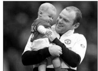
鲁尼父子 设计台词：宝贝儿，爸爸的第一个世界杯进球送给你！