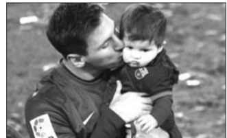
梅西父子 设计台词：儿子，赐予我力量，让我的小宇宙在世界杯爆发吧！