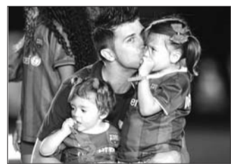
比亚父女 设计台词：闺女们，有你们在，输球真的不那么难受。