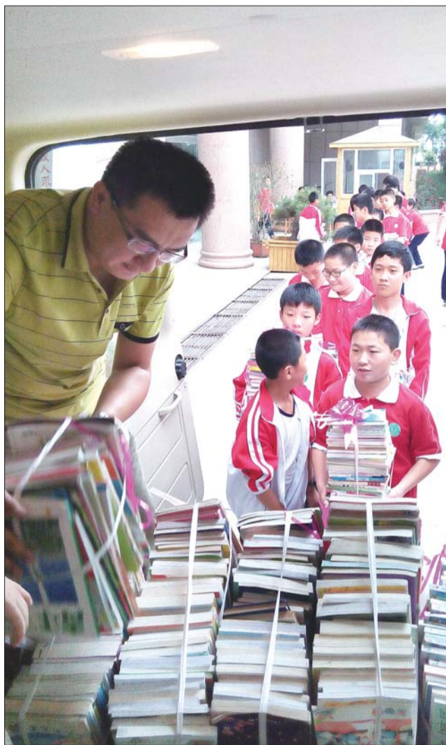
孩子们排队把爱心图书装车。

欢迎广大爱心人士、团体和企业等继续拨打本报热线96706126为沂蒙老区捐书。您也可以直接把图书寄到以下地址:济南市历下区经二路6号山东新闻大厦,齐鲁晚报张刚工作室,邮编250014,联系电话96706126,13884999594。