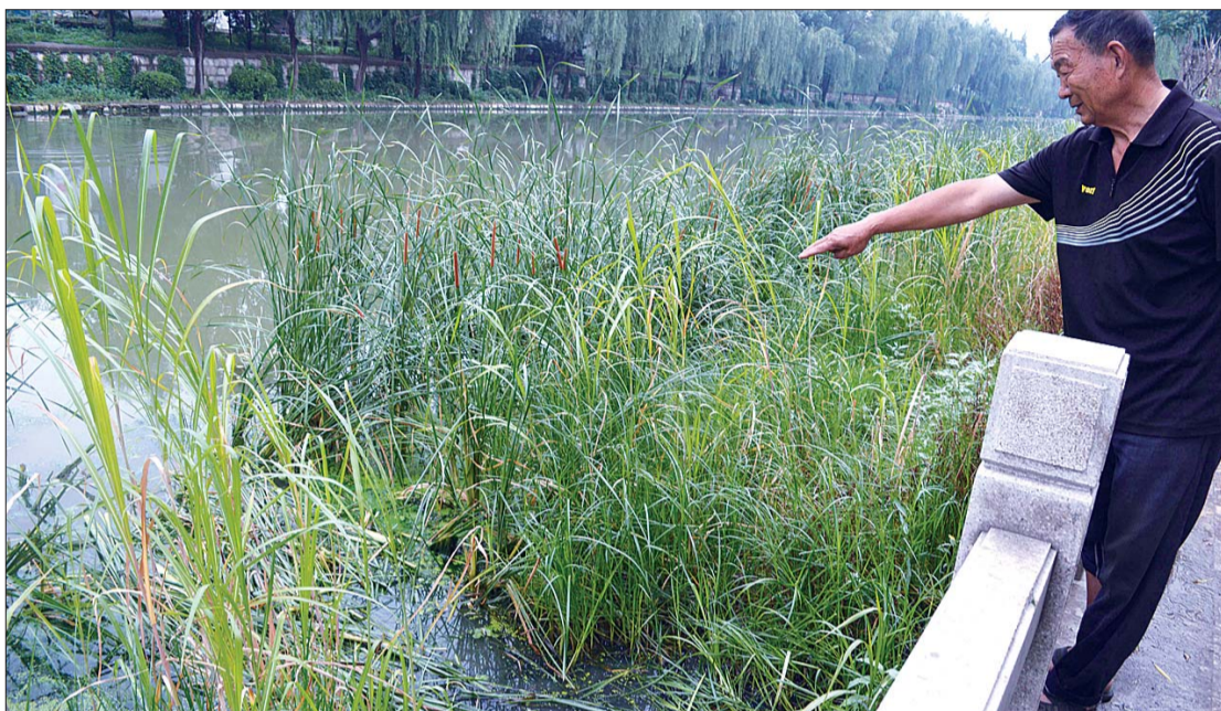
蒲苇荡无端被割出来的路。

本报济宁6月16日讯(见习记者 于伟) 济宁城区老运河济安桥段, 有一处栽了3年的蒲苇荡。近日, 这片蒲苇荡无端多出6条路, 原来这是钓鱼者为图方便用镰刀割出来的。